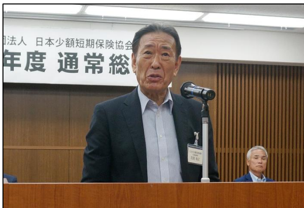
花岡会長 冒頭挨拶